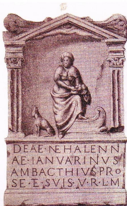
Domburgs Nehalennia-altaar

geven de ruimte een wat mystieke uitstraling. De Heilige Graal staat meerdere keren op reliëfs afgebeeld en het is een gebouw waarin vrouwelijke beeltenissen in overvloed aanwezig zijn, heiligen die allemaal in verband te brengen zijn met verhalen over verschijningen. Misschien was het het lichtblauwe interieur dat me meteen een link met Nehalennia liet leggen, want in Domburg is er een altaar opgedoken dat nog blauwe verfsporen bevat. Een glas-in-loodraam, bij binnenkomst zichtbaar aan de rechterzijde, toont een veelbesproken bootje, omdat de beeltenis voor velerlei interpretaties vatbaar is. Gedrukt op een kaart zou het als afbeelding niet misstaan in een tarotdeck en het heeft iets weg van de kaart van Het Rad van Fortuin. Een speculatie is dat het zou herinneren aan Jules Verne, die graag in dit dorp op vakantie ging en het bekende boek Naar het middelpunt der aarde schreef, waarbij hij zich liet inspireren door de mysterieuze berg. In zijn boek Clovis Dardentor , speelde een kapitein Bugarach met een zeilboot een rol. Andere onderzoekers veronderstellen dat het raam verwijst naar de Ark van Noach of verbeeldt dat een schat van Koning Salomo over de zee vervoerd is. Wat mij betreft mogen daar mijn gedachtengangen aan toegevoegd worden, waaruit een hypothese voortvloeit waarover ik nog nergens iets heb gelezen.