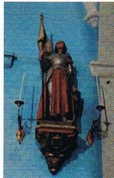
V.l.n.r. kerkje te Bugarach, glas-in-lood, zwaarden aas onder Jeanne d'Arc